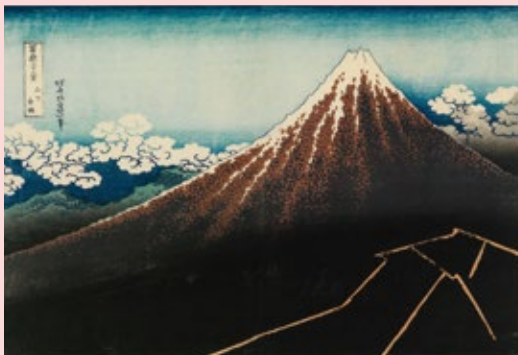
「富嶽三十六景 山下白雨」(前期)