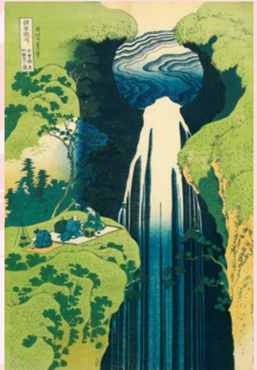
「諸国瀧廻り 木曾路ノ奥阿弥ヶ瀧」(前期)

すみだ北斎美術館が所蔵する二大名品「富嶽三十六景」シリーズと、当館開館記念展で約100年ぶりの再発見として話題となった幻の絵巻「隅田川兩岸景色図巻」を中心に、人気の高い北斎作品約100点を一堂に展覧します。今回はじめて「富嶽三十六景 山下白雨」のバージョン違いを並べて展示、また北斎の錦絵「桜に鷹」等の版本を使用した火鉢を初公開するなど、見どころの多い展覧会です。北斎の名作の数々を通して、日本の四季の美しさ、江戸時代より観光スポットとして知られる隅田川の名所の魅力、そして北斎のたぐい稀な筆力と発想力をご堪能ください。