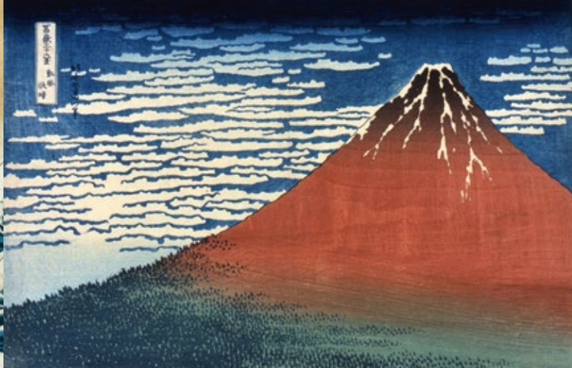
「富嶽三十六景 凱風快晴」(後期)