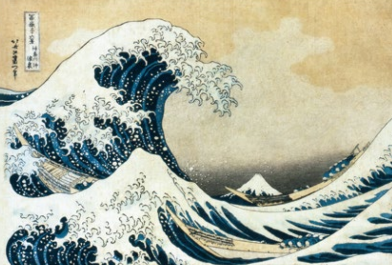
「富嶽三十六景 神奈川沖浪裏」(後期)